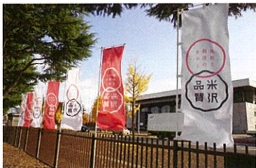
のぼり旗 (防災処理済) (赤白2枚組 180×60cm)