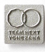
ピンバッチ 19mm 1個100円(税込)