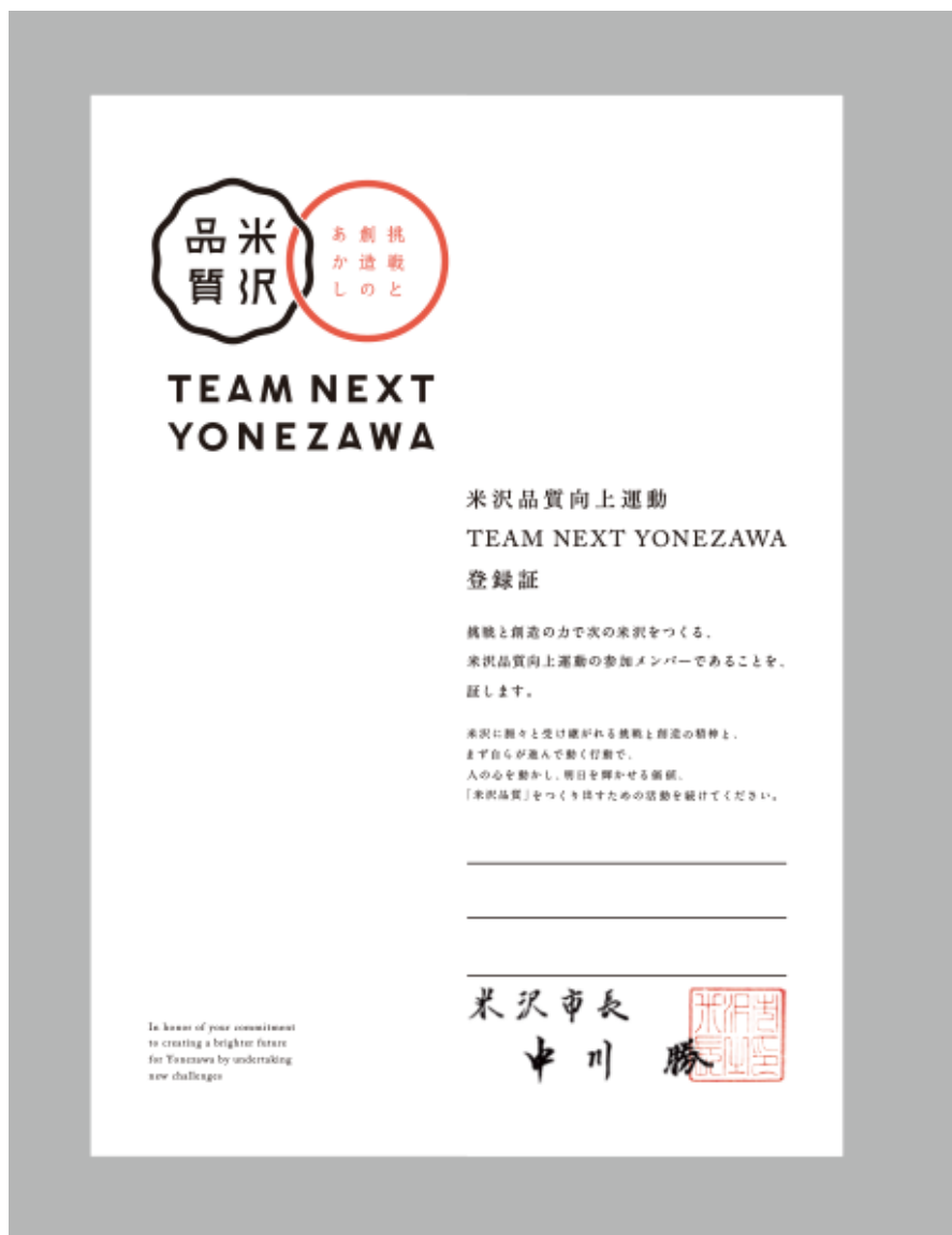
(A 4 サイズ)